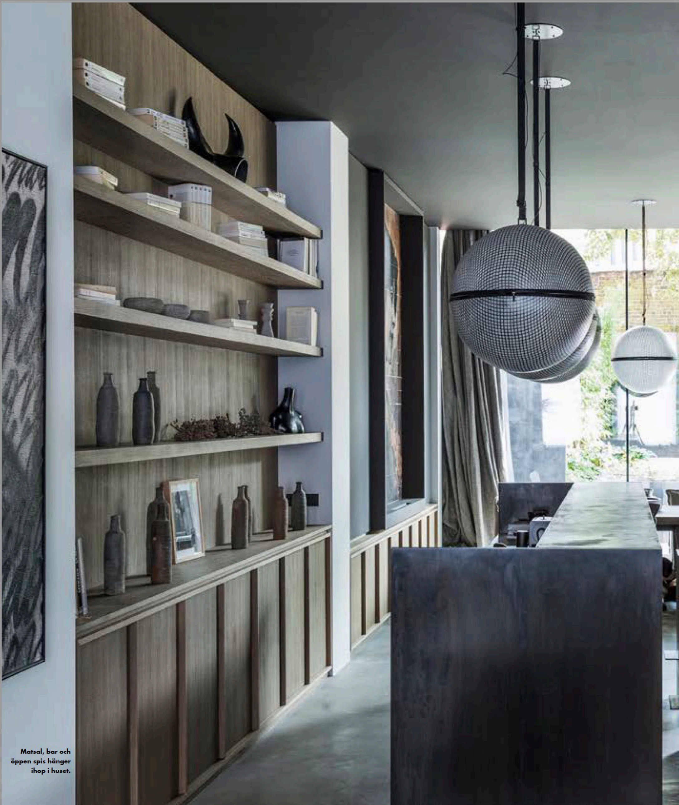
Matsal, bar och öppen spis hänger ihop i huset.