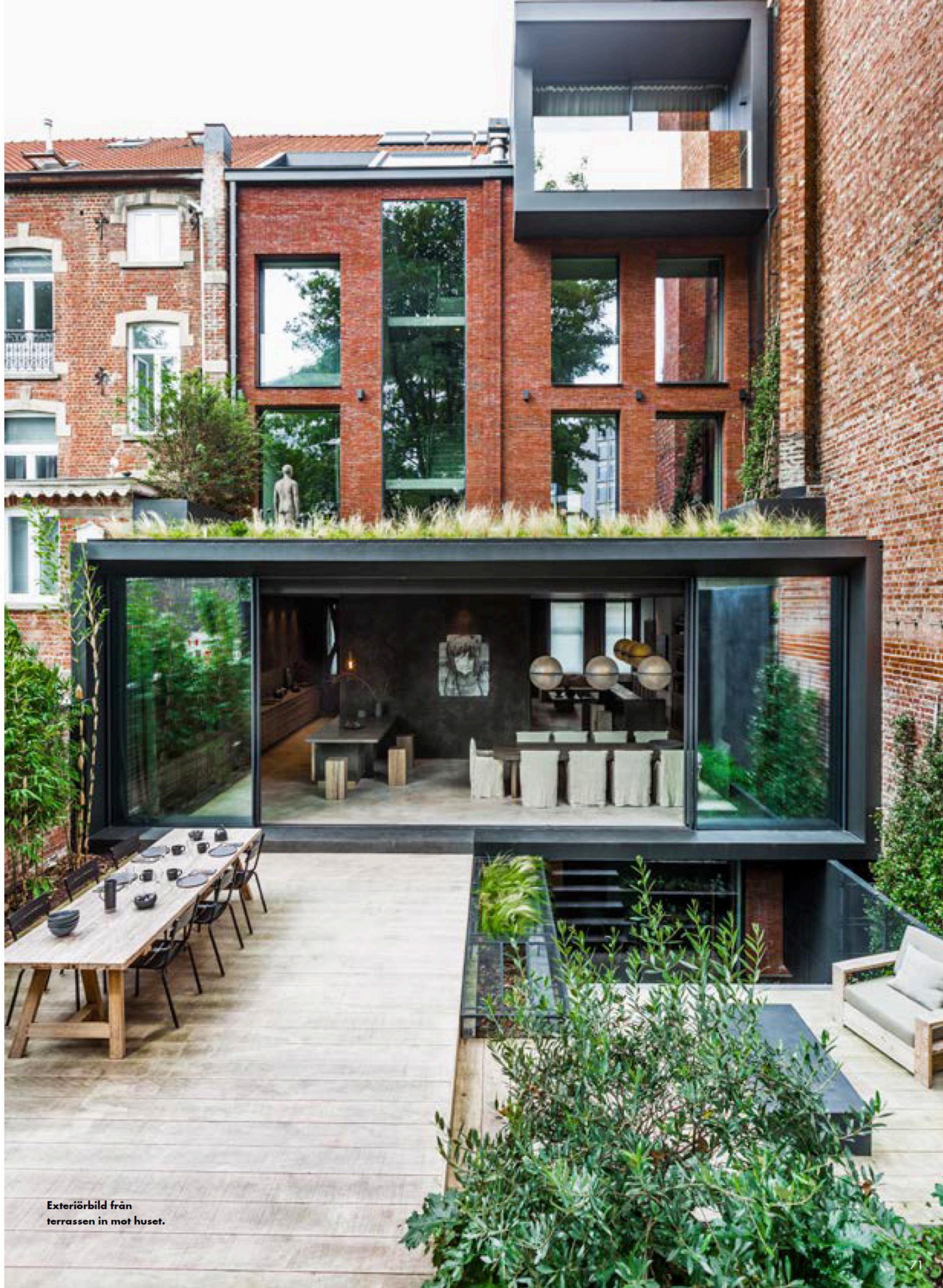
Exteriörbild från terrassen in mot huset.